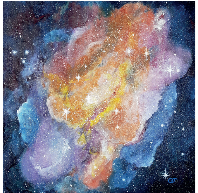
Paysage cosmique pigments, aquarelle, tempera à l'œuf et huile sur toile, 30x30