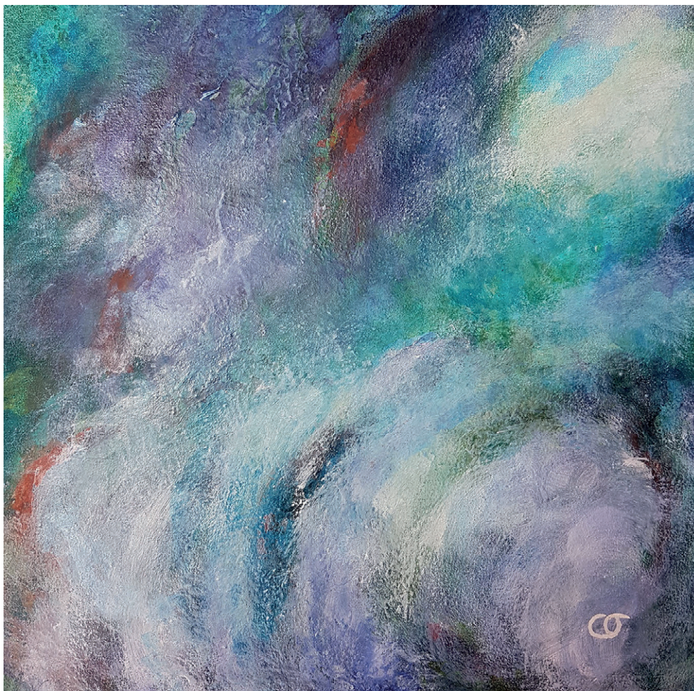
La terre vu du ciel

pigments, aquarelle, tempera à l'œuf et huile sur toile, 30x30