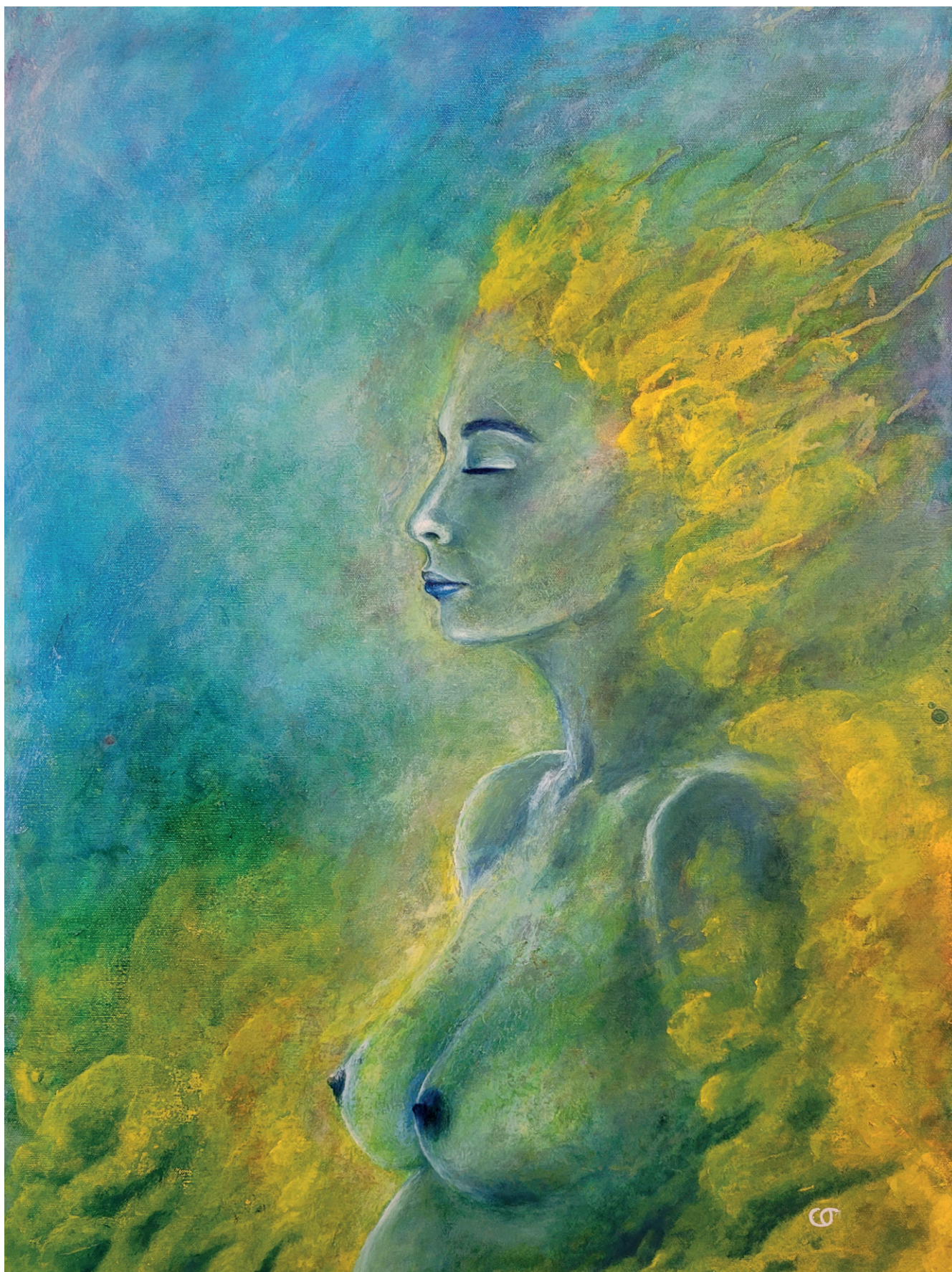
Pachamama pigments, aquarelle, tempera à l'œuf, huile sur toile, 60x80