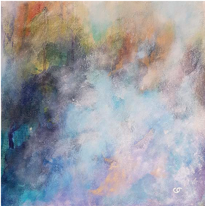
Entre terre et eau pigments, aquarelle, tempera à l'œuf et huile sur toile, 30x30