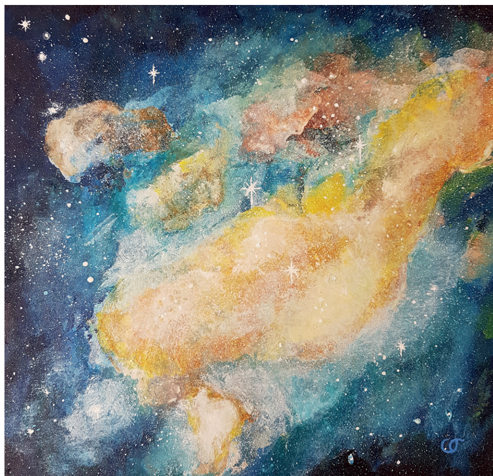
Paysage cosmique 2

pigments, aquarelle, tempera à l'œuf et huile sur toile, 30x30