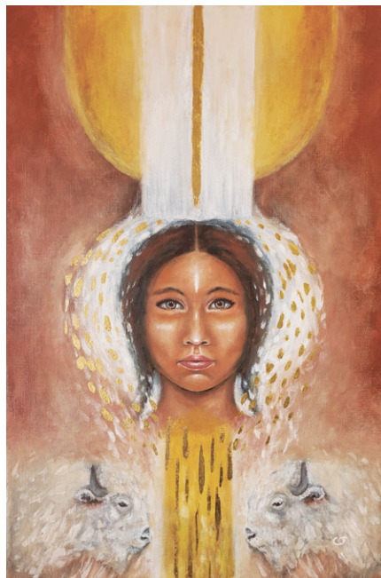
Femme bison blanc